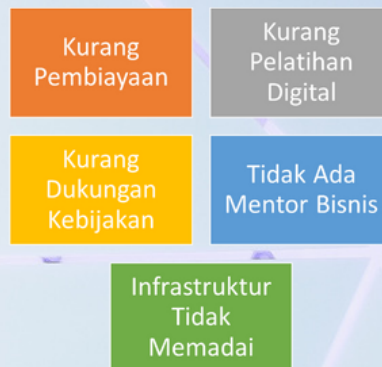
Sumber: Boston Consulting Group (BCG) & Telkom Indonesia, 2022

Tantangan lainnya adalah kurangnya keterampilan dan pengetahuan digital di kalangan pemilik UMKM dan karyawan, terutama di daerah pedesaan. Hal ini mempersulit mereka dalam memanfaatkan teknologi dengan efisien. Holiseh & Izzatusholekha (2023) menemukan bahwa (1) kurangnya adaptasi UMKM terhadap perkembangan teknologi menyebabkan penjualan dengan digital marketing belum optimal; (2) peran Pemda belum optimal di dalam mendorong UMKM ke arah digitalisasi. Dalam penelitiannya, Melany, et al., (2022) menilai pelatihan yang diberikan belum maksimal karena akses yang terbatas, belum tepat sasaran, terkesan hanya menjalankan program, dan belum dipantau secara berkelanjutan.