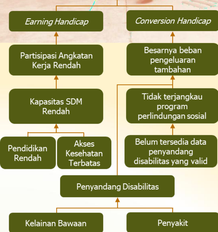
Gambar 1. Strukturisasi Masalah Kesejahteraan bagi Penyandang Disabilitas